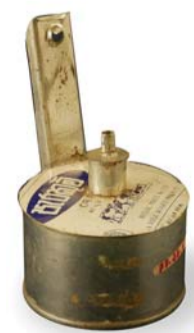
Lampa från Sri Lanka, tillverkad av en konserverburk. En av många sevärda ting på Världskulturmuseet.