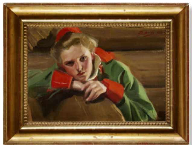
NYA TAVELVÄGGAR TILL AUKTIONSKOMPANIET. KANSKE MED PLATS FÖR EN OCH ANNAN ZORN?

När BUKOWSKI-ägda AUKTIONSKOMPANIET uppdaterar interiören involveras C&D Snickeri. I uppdraget ingår leverans av tavelväggar och podier i laminerade och målade material med syftet att på ett propert sätt presentera de värdefulla verk som går under klubban i Auktionskompaniets lokaler. Bakom formgivningen av inredningen ligger URBAN DESIGN och C&D Snickeris uppdragsgivare är M.E.R. SOLUTION AB.