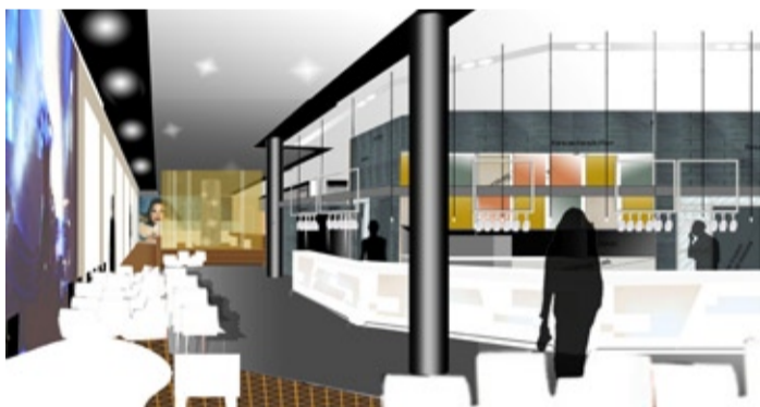
ILLUSTRATION: LARS HELLING

Incontro öppnades 2001 i samband med att man för