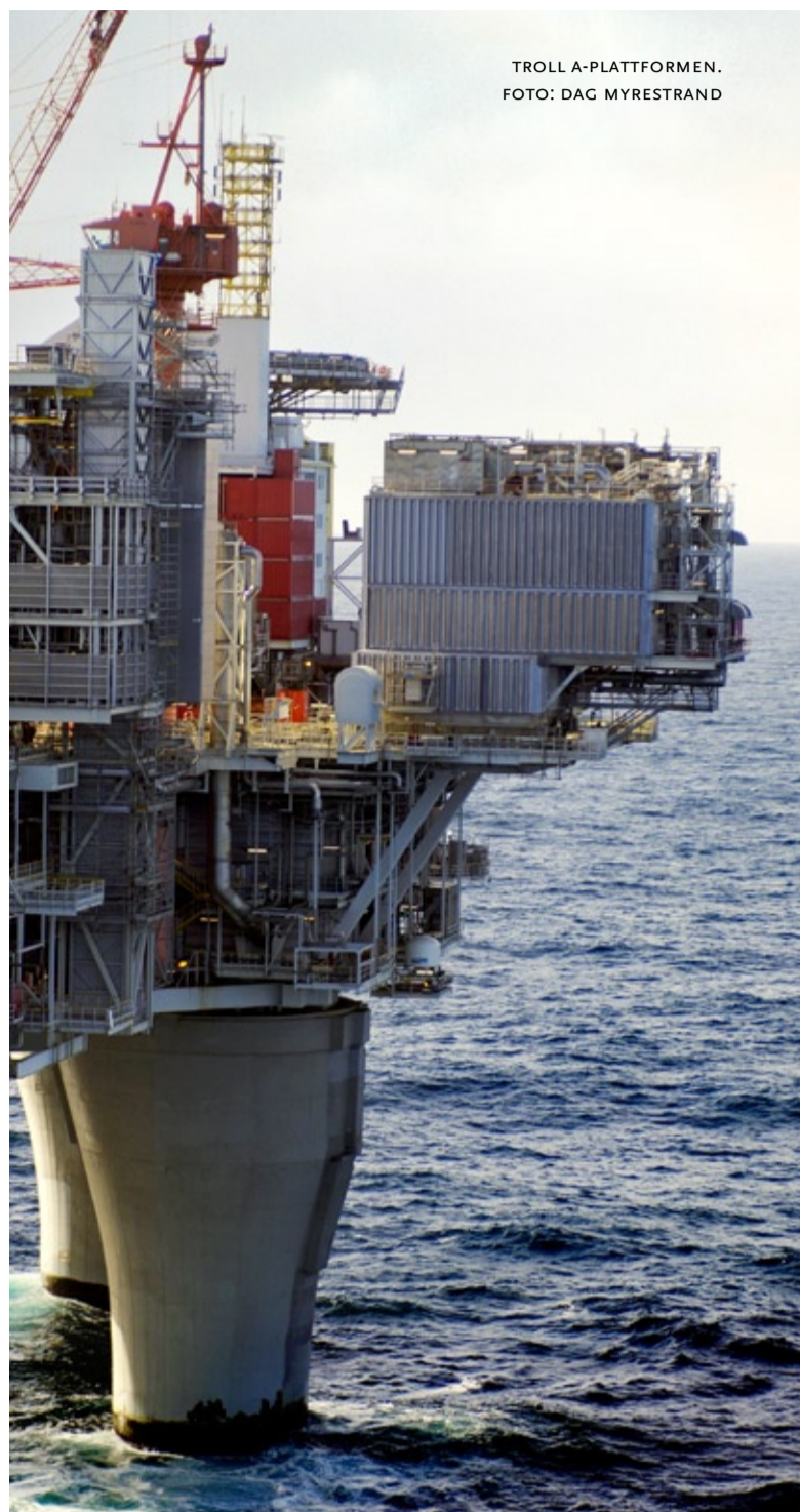
TROLL A-PLATTFORMEN.

Leirvik MT har i sin tur anlitat C&D Snickeri som har erfarenhet från inredningsuppdrag för offshoreindustrin, bland annat för uppdragsgivaren EMTUNGA. C&D Snickeri kommer för Troll A-plattformen att utföra inredningsarbeten där kärnan består av lättviktsmaterialet honeycomb-board – ett material som lämpar sig utmärkt för krävande miljöer där man ställer höga krav på låg vikt samt brandsäkerhet.