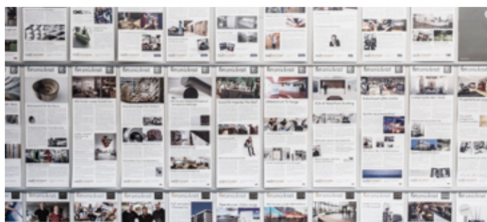
STRAX ÖVER ETT FEMTIOÅR UTGÅVOR HAR DET BLIVIT UNDER ÅREN. NÄSTA NUMMER KOMMER I DIGITAL FORM.

Det nyhetsbrev du håller i handen blir det sista i tryckt form. Nästa nummer kommer i digital form via e-post. Om du är en trogen läsare – se till att vi har din e-postadress! Boka din fortsatta prenumeration på vår webbplats: www.cdsnickeri.se