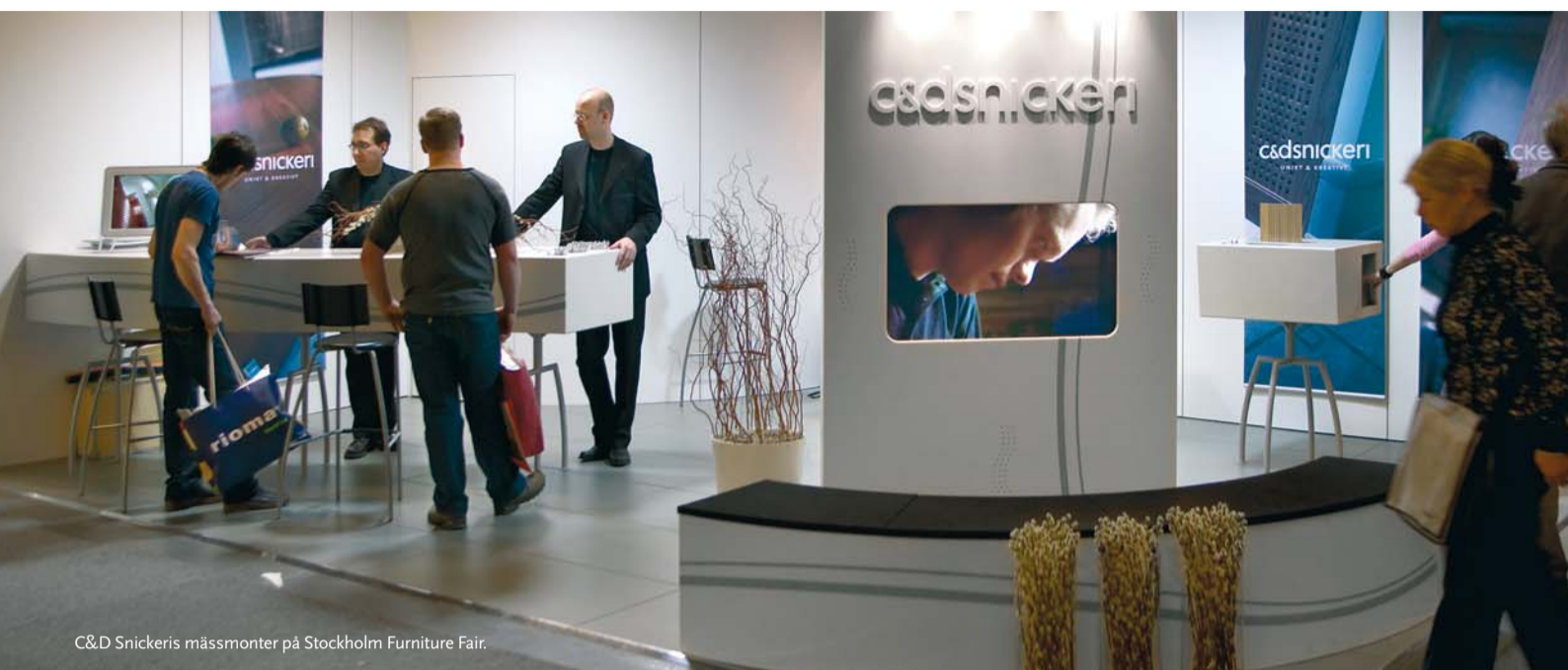
C&D Snickeris mässmonter på Stockholm Furniture Fair.

Stockholm Furniture Fair och Northern Light Fair fick en fantastisk uppgång i antalet fackbesökare som ökade med dryga elva procent.