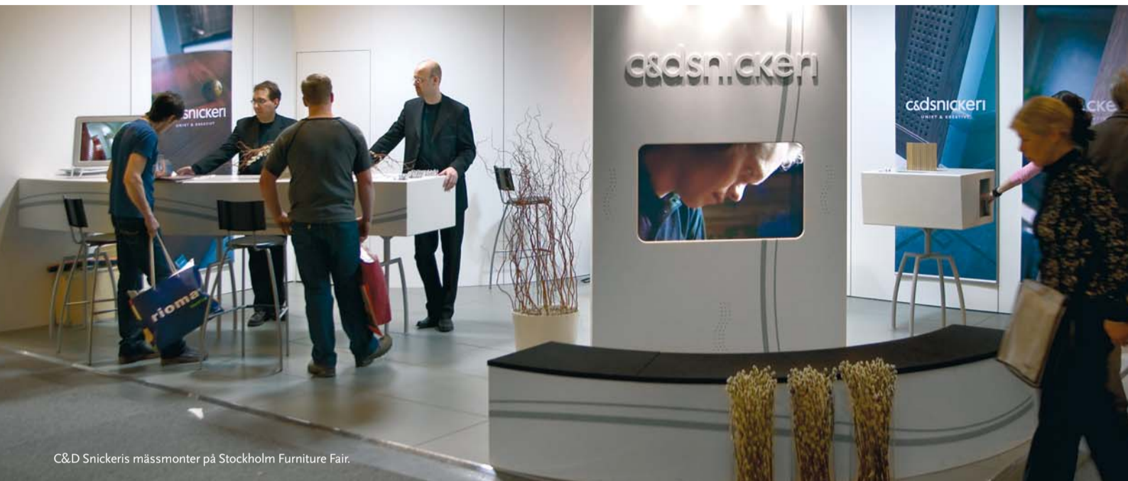
C&D Snickeris mässmonter på Stockholm Furniture Fair.

Stockholm Furniture Fair och Northern Light Fair fick en fantastisk uppgång i antalet fackbesökare som ökade med dryga elva procent.