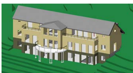
CAD-ritning på Villa Onsjo.

Ett av landets mest exklusiva privatboenden byggs just nu strax utanför Halmstad. Huset har fått sin form genom Malmöbaserade arkitektfirman KROOK & TJÄDER. C&D Snickeri har fått uppdraget att leverera entrépartier, dörrar och inredningen till trapphuset. Produktionen sker i C&D Snickeris anläggning i Falköping och monteras på plats i Halmstad. Uppdragsgivare är PIAB.