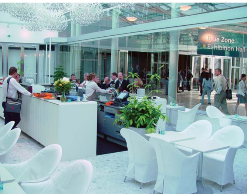
Restaurang The Garden, Stockholmsmässan.

MÄSSRESTAURANGER är företaget bakom Stockholmsmässans tolv serveringar. Dagligen förser man mässbesökare med allt från espresso till 3-rätters middagar, under Stockholmsmässans ca 70 olika mässprojekt årligen. Mottot är att "god mat och bra service är viktigt för en positiv upplevelse".