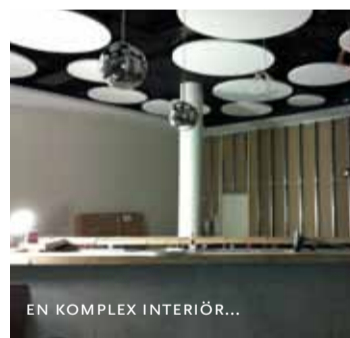
EN KOMPLEX INTERIÖR...