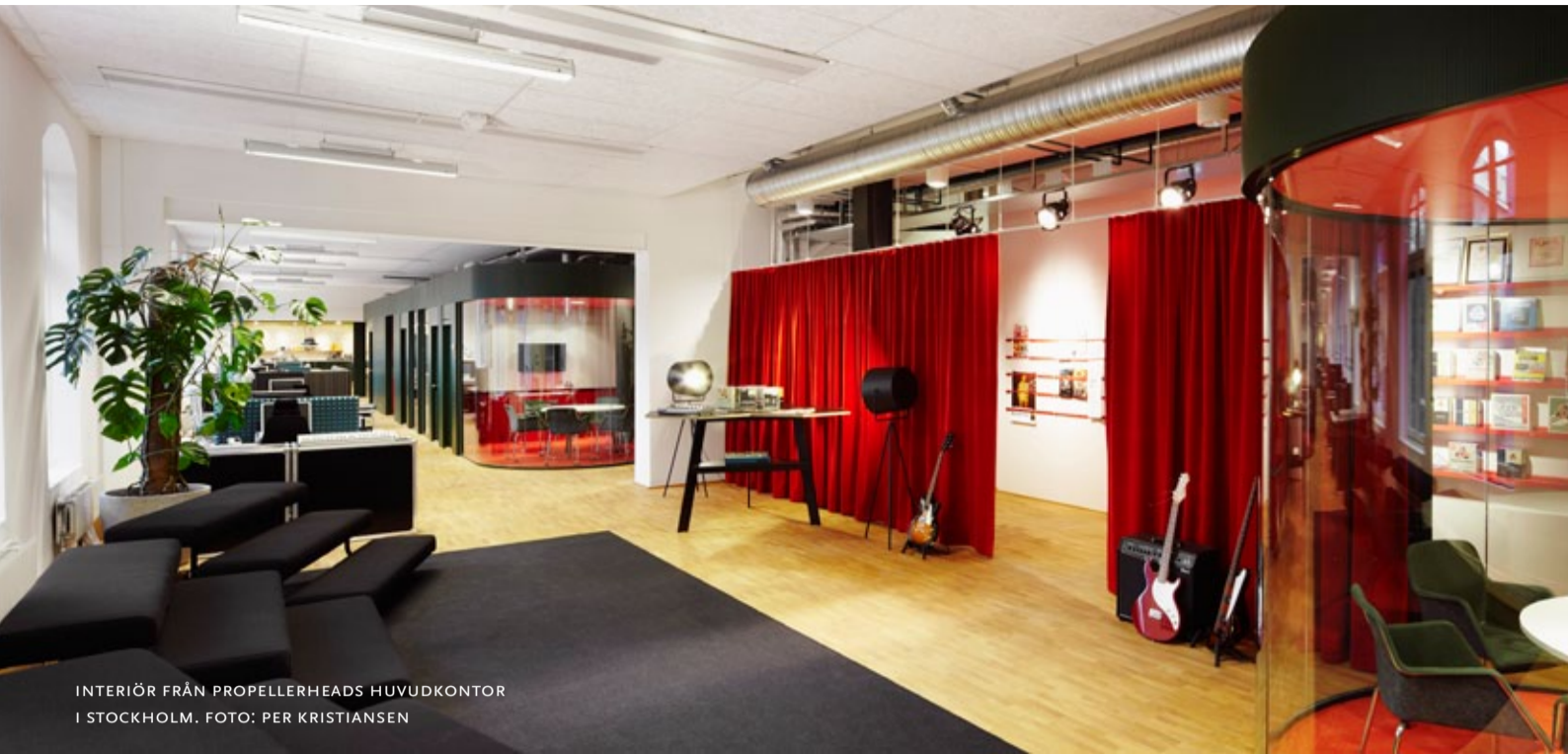
INTERIÖR FRÅN PROPELLERHEADS HUVUDKONTOR I STOCKHOLM.