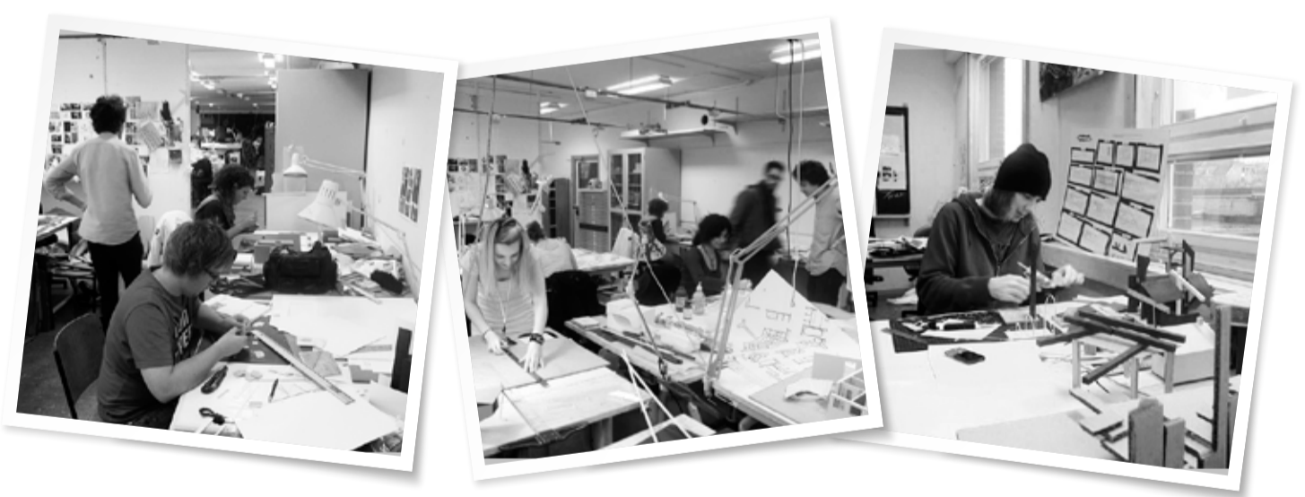
NÄSTA GENERATIONS ARKITEKTER "IN ACTION".

Ombyggnaden påbörjades 1 juli 2007 och i augusti 2009 kunde huset åter tas i bruk. C&D Snickeri har varit bidragande i projektet genom att leverera bland annat salsoffor, bord i magistratsalen, biblioteksdisk, hyllor i bibliotek, monterskåp, fristående broschyrställ och mycket mer.